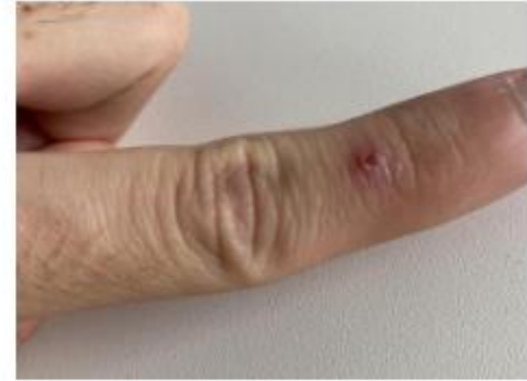
Monkeypox on finger, phase 3