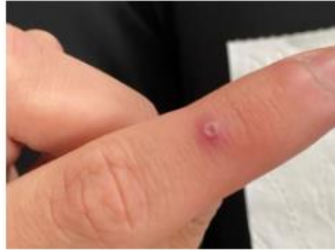
Monkeypox on finger, phase 2