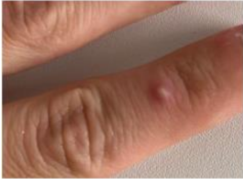
Monkeypox on finger, phase 1